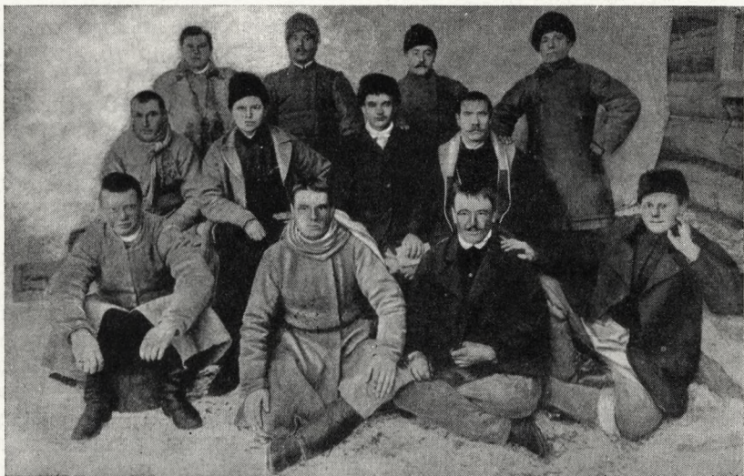
ДУХОВОРЫ В ЯКУТСКОЙ ОСЫЛКЕ